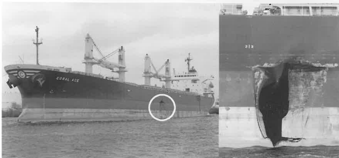
Der Bulker „Coral Ace“ lief mit dem Loch im Rumpf den Hafen von Wilhelmshaven für nötige Reparaturarbeiten an

„Lisa Schulte“ und „Coral Ace“ kollidieren aus noch ungeklärter Ursache vor der Wesermündung – Keine Verletzten