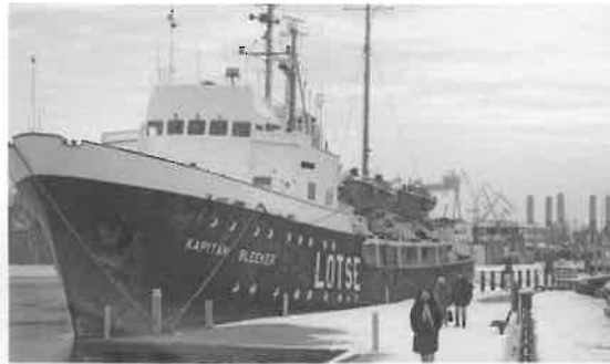
Die „Kapitän Bleeker“ gehört jetzt einer Charterfirma