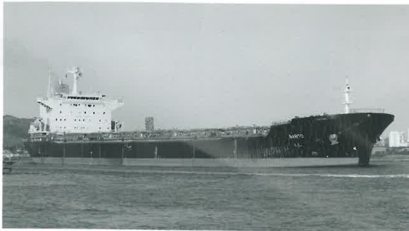
Der Bulk-Carrier „Barito“ transportiert 70 000 Tonnen Kohle in Charter von Klaveness

"Cape Ray" , 177 853 tdw, blt 2007, delivery Far East Feb. 9, 14 months trading, 10 900 $ daily, Oldendorff "Maverick Gunner" , 80 717 tdw, blt 2010, delivery Santos Feb. 18-23, rede-